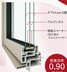
トリプルサッシ (掃出しサッシ部分)