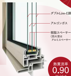
トリプルサッシ (掃出しサッシ部分)