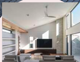
スロープ シーリング